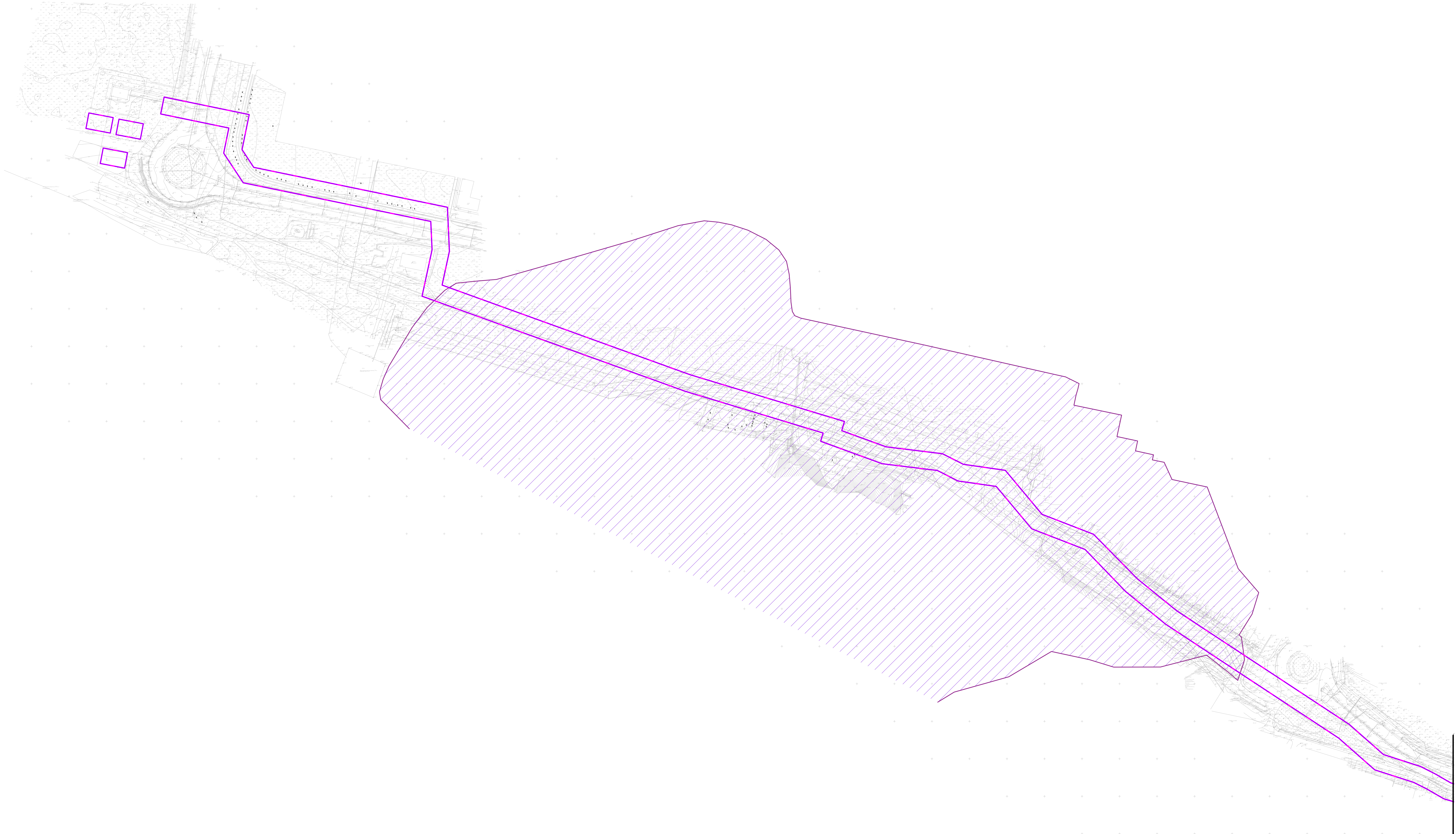
Схема расположения листов